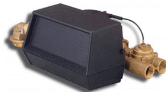
1" Automatisk ventil med vand måler